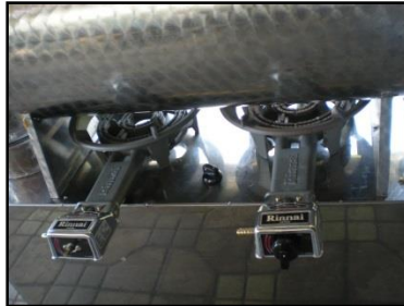
Gambar 7 Pemasangan Kompor