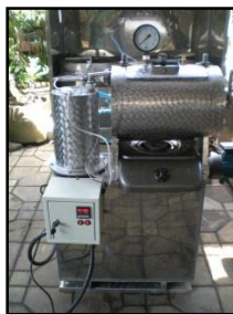
Gambar 9 Hasil Pemasangan (Tampak Depan)