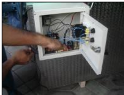
Gambar 8 Pemasangan Saluran Bahan Bakar dari solenoid ke kompor