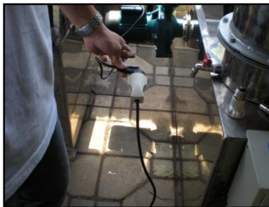
Gambar 2 Pemasangan Kabel Pompa