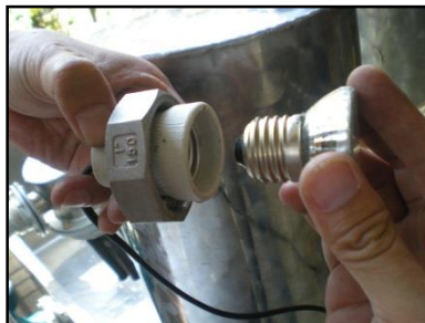
Gambar 3 Pemasangan lampu (pada tabung sisi kiri) dan pompa (pada bak air sisi kiri)