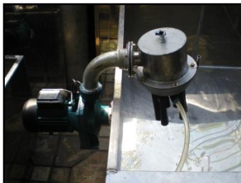
Gambar 6 Pemasangan Saluran Penghubung Pompa dengan Jet Air (pada jet air)