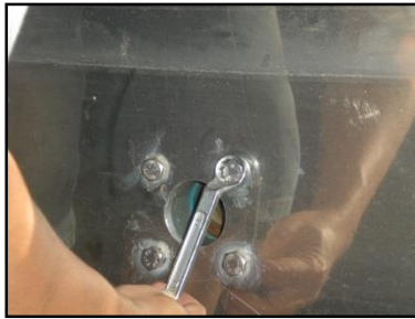
Gambar 4 Pengencangan Baut Pompa (dari dalam bak air) pada Bak Air