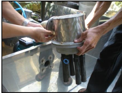
Gambar 5 Pemasangan Saluran Penghubung Pompa dengan Jet Air (pada pompa)