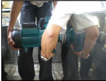
Gambar 1 Pemasangan Pompa (Tampak dari Luar)